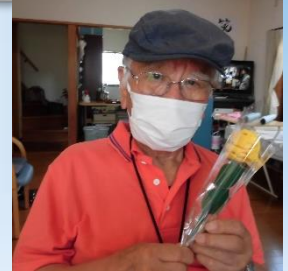
「これ、仏壇に供えるわね」(笑)